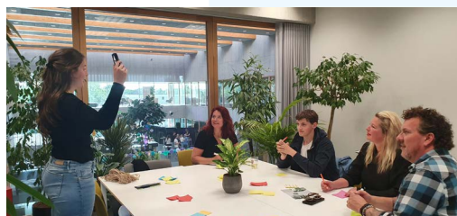
Tijdens de open dag konden ouders en geïnteresseerden kennis maken met de initiatieven.