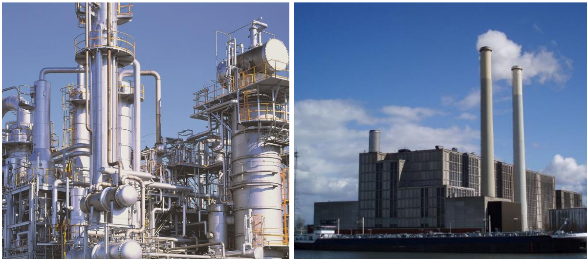
Foto 1 links een procesinstallatie en rechts de energiecentrale Harculo te Zwolle

In dit interpretatiedocument wordt uitleg gegeven wanneer er sprake is van een bouwwerk en een object en wanneer een sloopmelding moet worden aangeleverd.